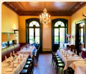
Beletage Großer Alstersalon