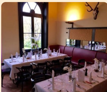
Beletage Kleiner Alstersalon

Größe: 250 qm Bis 120 Personen (sitzend)